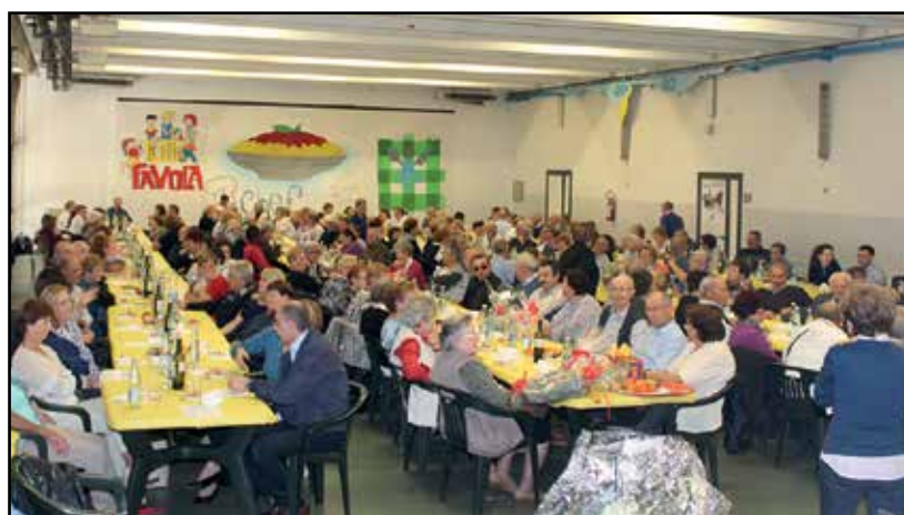
I numerosi presenti al pranzo.