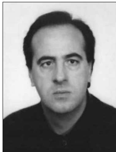
Giovanni Pesci 3° anniversario