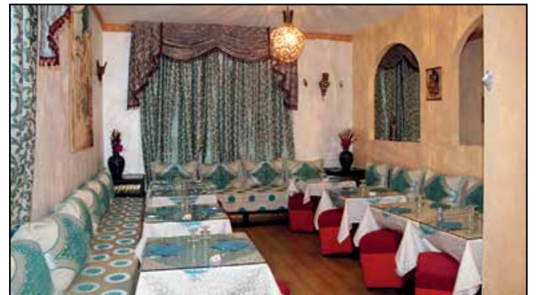
NUOVA SALA RINNOVATA PER APPUNTAMENTI

MENU' ALLA CARTA PIATTI DELLA CUCINA SIRIANA VINO BIANCO-ROSSO-BIRRA-GRAPPA SIRIANI