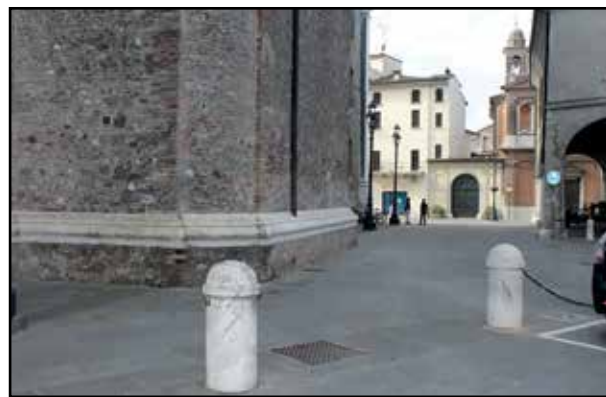
Eventuale ingresso dei parenti al seguito del feretro.

All'arrivo del feretro i famigliari che seguono in macchina devono parcheggiare a notevole distanza, correndo ansimanti per raggiungere il feretro del loro congiunto prima che esso giunga in Chiesa. In quel momento i secondi diventano minuti e l'attesa lascia un vuoto in un silenzio sur-