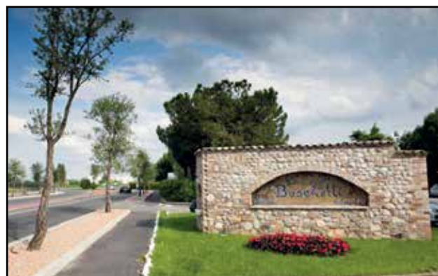
L'entrata del Green Park Boschetti.