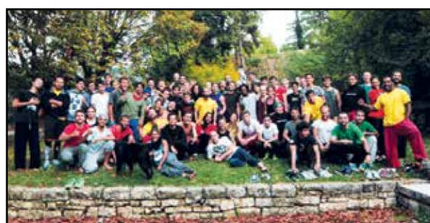
I partecipanti alla gara.

Con l'evento "Esprit Yamak" svoltosi il 26 e 27 Settembre 2015, Matsan Bro's ha portato nel cuore di Brescia quattro dei nove fondatori di questa disciplina conosciuti dai traceur di tutto il mondo. In questi due giorni di Workshop ed allenamento i quattro Yamakasi hanno guidato un centinaio di atleti tra salti, ar-