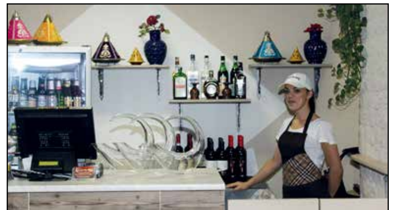
BAR: BIBITE E LIQUORI DELLE MIGLIORI MARCHE - VINO D.O.C.

APERTO da Lunedì a Domenica SOLO SERA 18,30 - 24,00 chiusura cucina ore 23