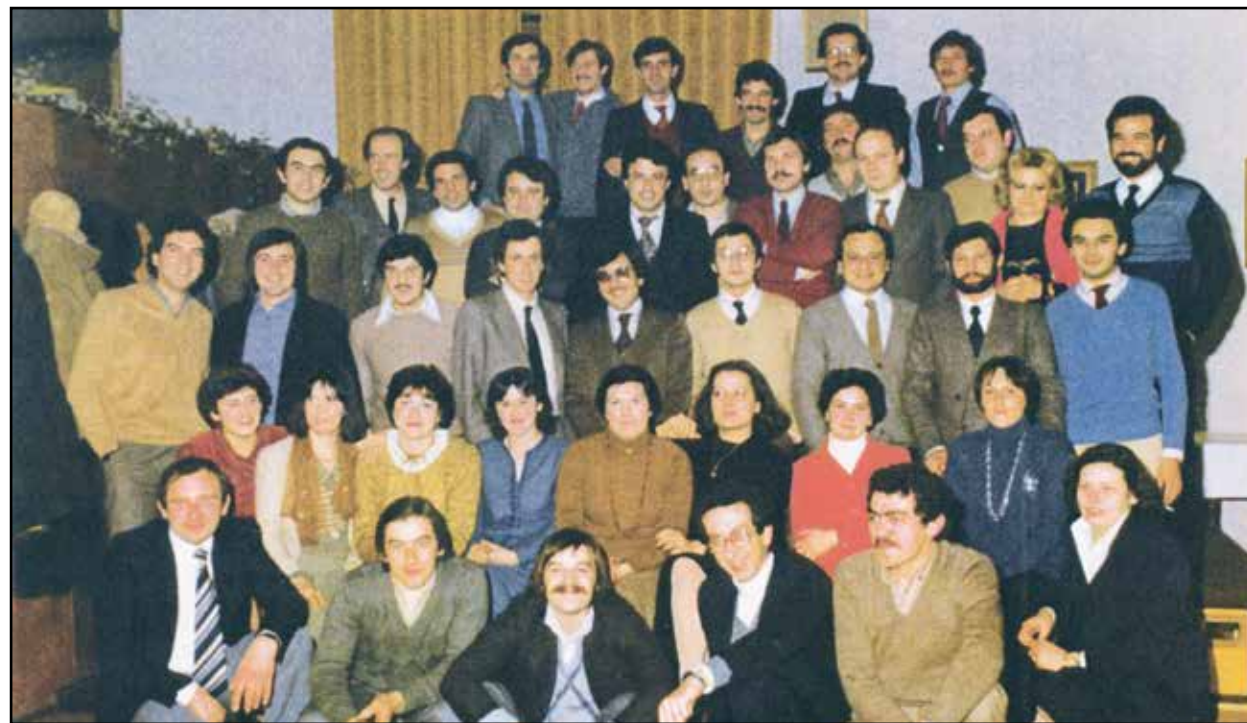
I coetanei del 1950 riuniti nella festa di classe del 1980.

diversi anni. Complimenti al fotografo che è riuscito a ritrarre tutti i componenti in una serata speciale.