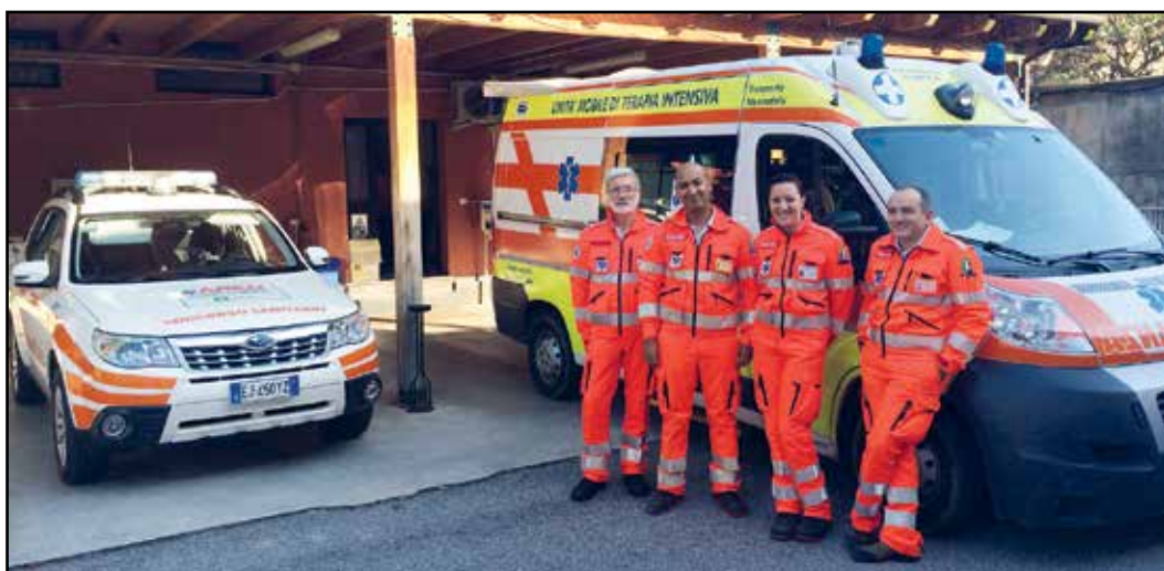
Alcuni militi della sezione montecelarense di Croce Bianca di Brescia con mezzi di soccorso.

Alla serata della salute di Garda Vita, in calendario per venerdì 30 ottobre 2015 presso l'Auditorium Garda Forum, non poteva mancare la sezione montecelarense di Croce Bianca di Brescia, da sempre impegnata nella gestione dell'emergenza sanitaria. All'esterno dell'Auditorium verranno posizionati alcuni mezzi di soccorso e saranno presenti i militi con l'inconfondibile divisa d'ordinanza color arancione. Una sorta di benvenuto da parte di coloro che, quando si tratta di infarto, tutti vorrebbero avere a distanza molto ravvicinata.