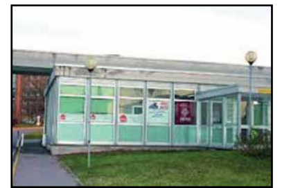
La sede dell'Avis.

Ricordiamo quindi che in questo periodo la segreteria funziona solo telefonicamente, allo 0309651693 e via e-mail