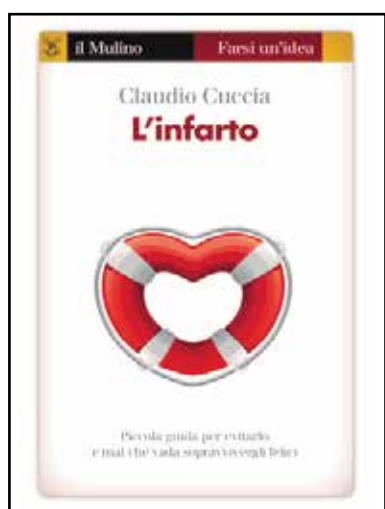
Foto della copertina del libro.

Ecco allora che il racconto dell'infarto prende le mosse da un "intendersi sulle parole"